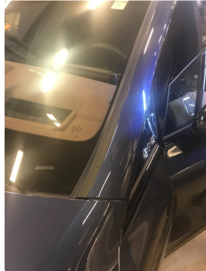
1.1 Liten stripe etter is skrape på vindu list