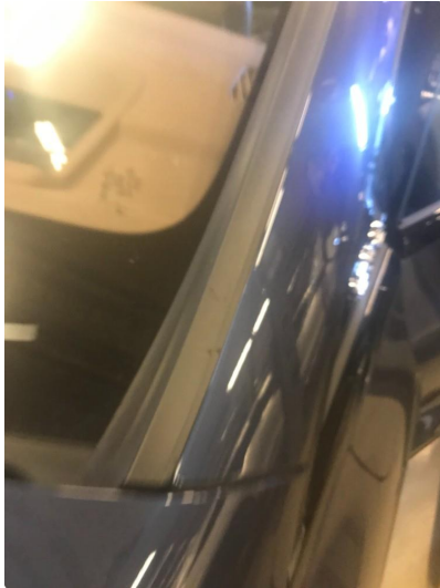
1.1 Liten stripe etter is skrape på vindu list