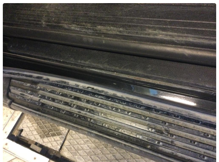
2.6 Slitt innsteg