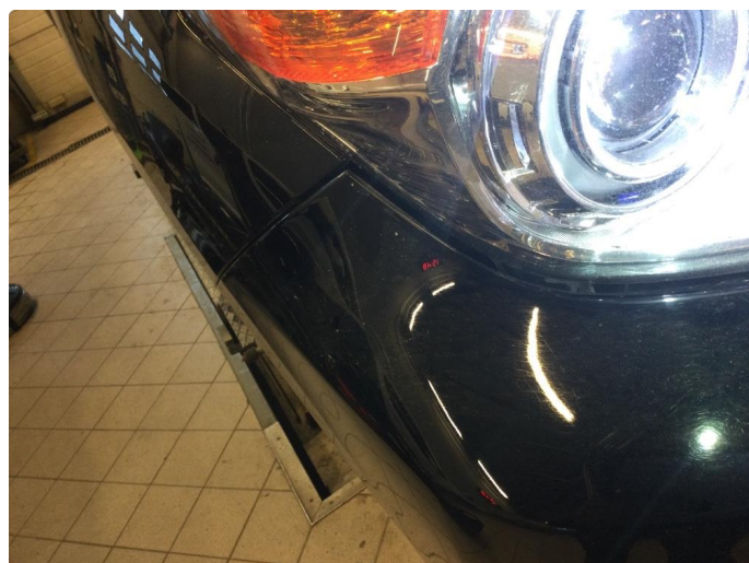
2.9 Øvrige feil