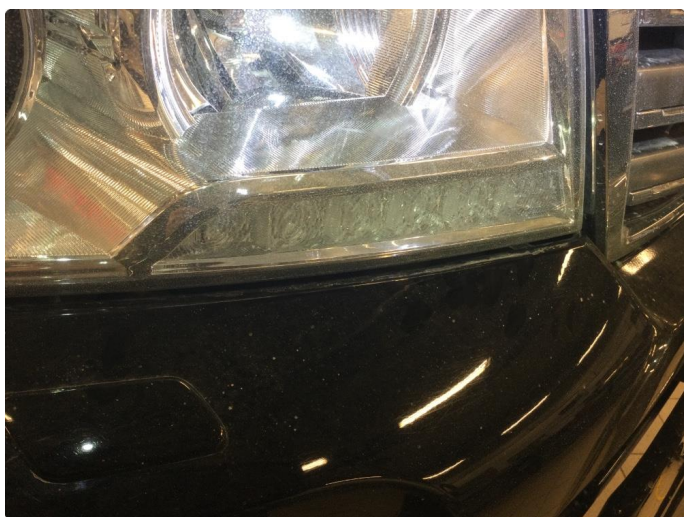
2.9 Øvrige feil