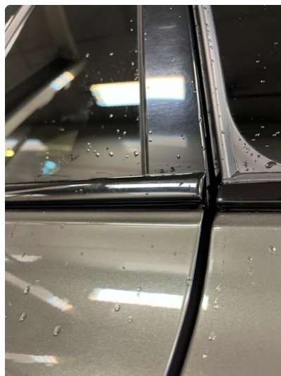
1.2 Løse/skadede lister