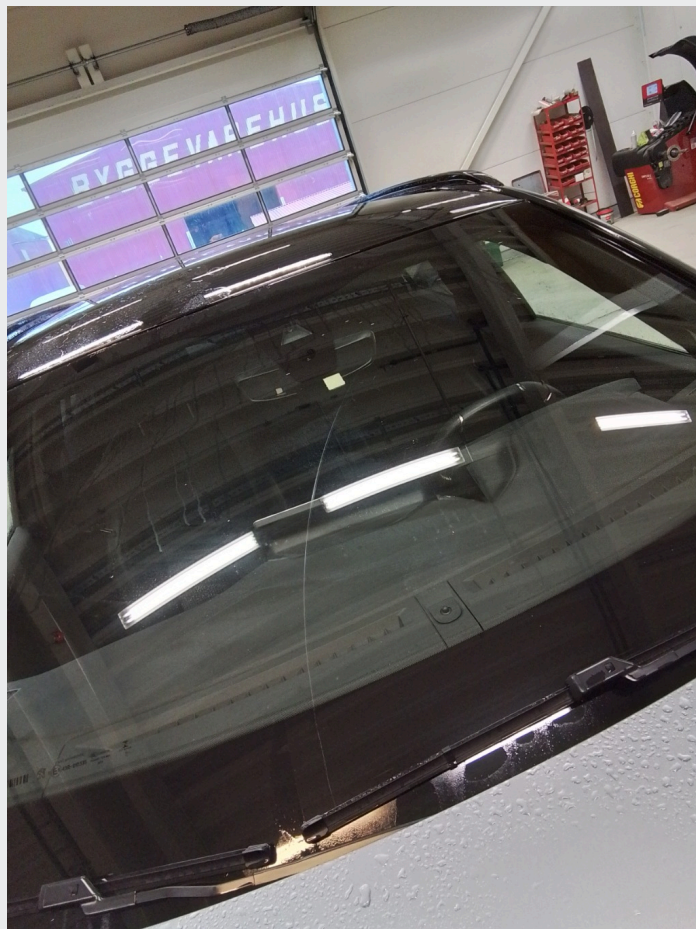
2.15 Stripe over frontvindu