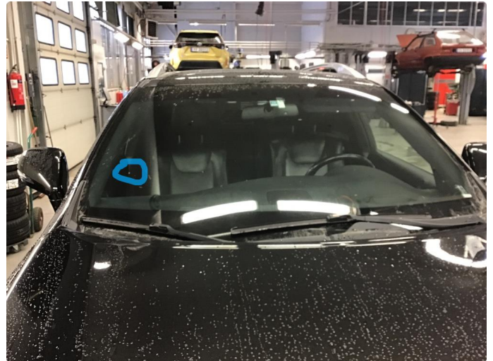
1.3 Lite steinsprang hs utenfor synsfelt.