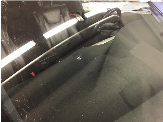
1.3 Lite steinsprang hs utenfor synsfelt.