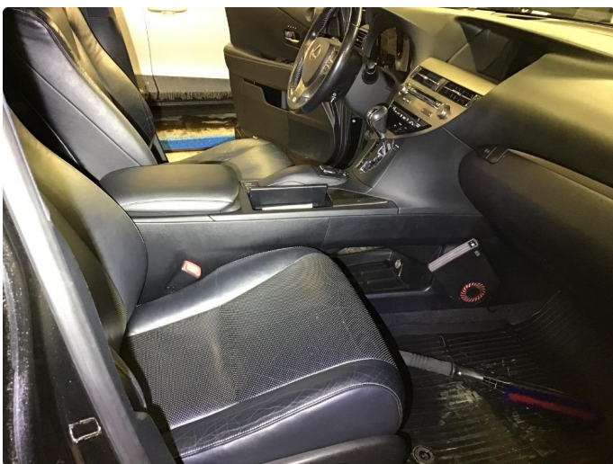
3.1 Litt bruksslitasje på seter.