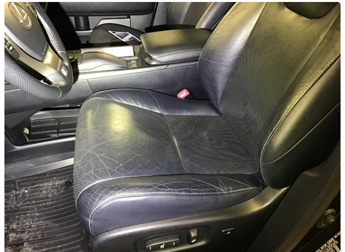
3.1 Litt bruksslitasje på seter.