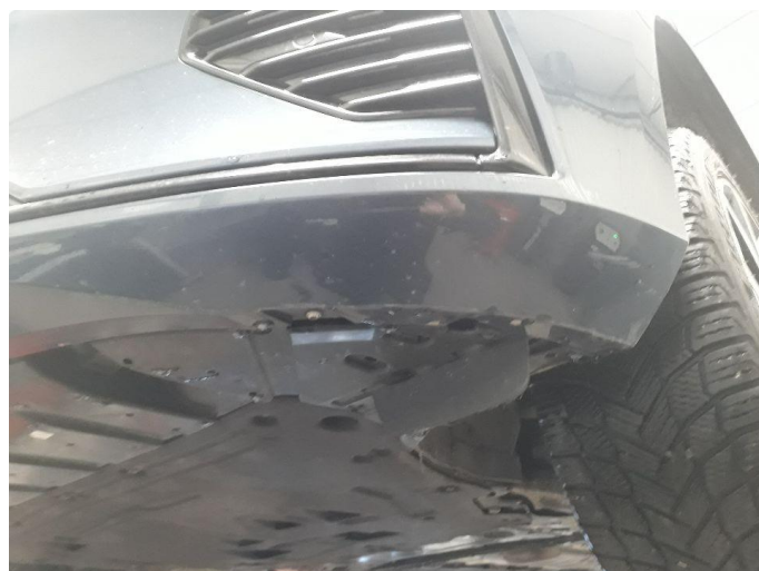
1.3 Skrubbskader underkant