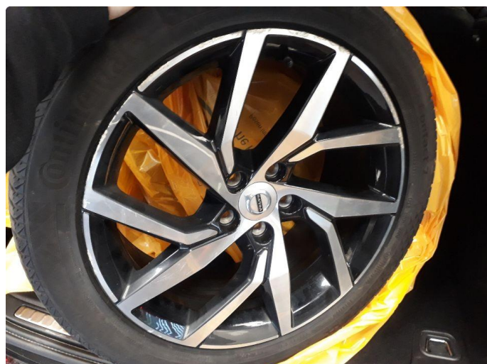
1.1 Kantskjørt felg