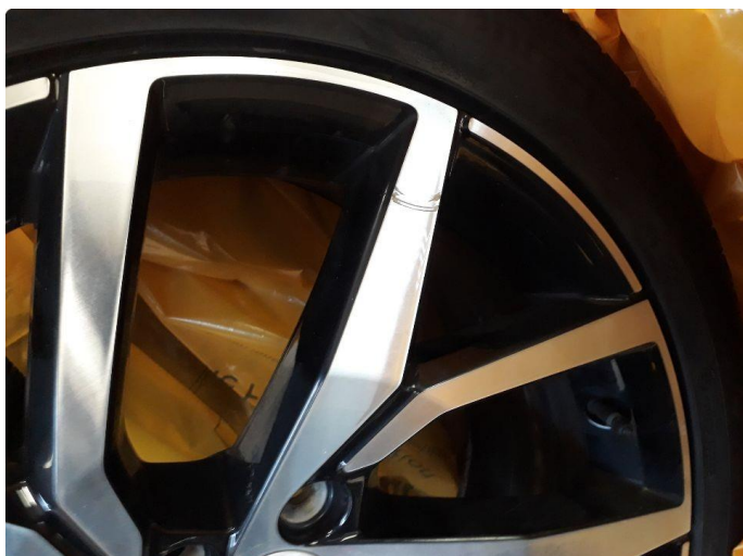
1.1 Kantskjørt felg