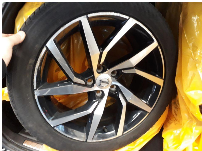
1.1 Kantskjørt felg