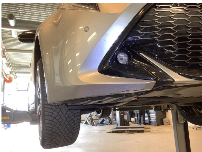
1.4 Ripe(r) ned til grunning