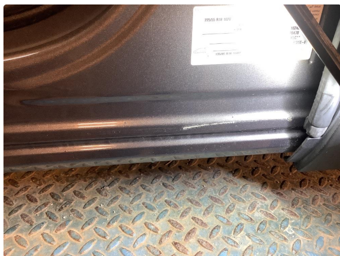
1.3 Liten stripe døråpning