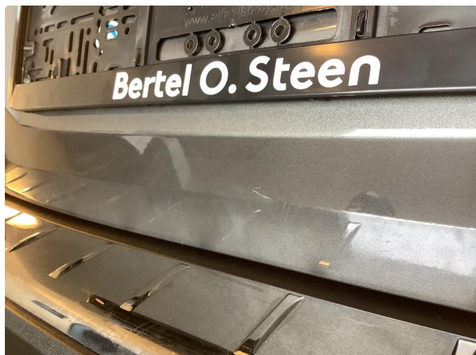
1.1 Liten ripe bakluke, kan poleres bort.