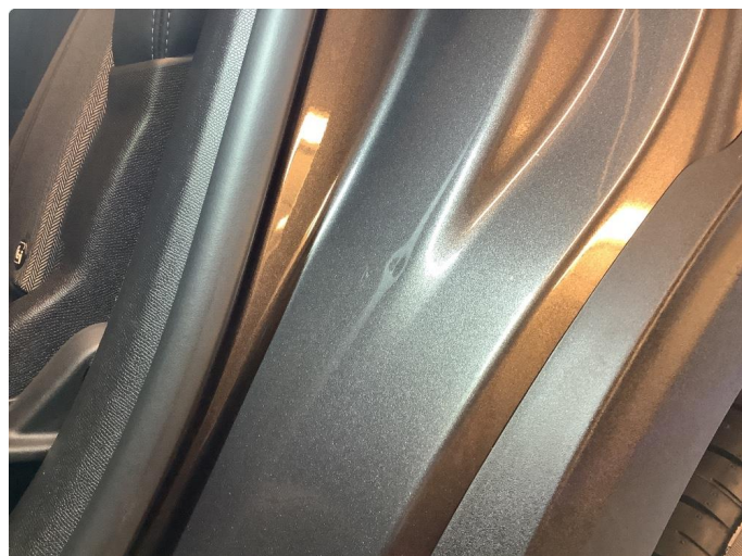
1.2 Liten bulk i døråpning