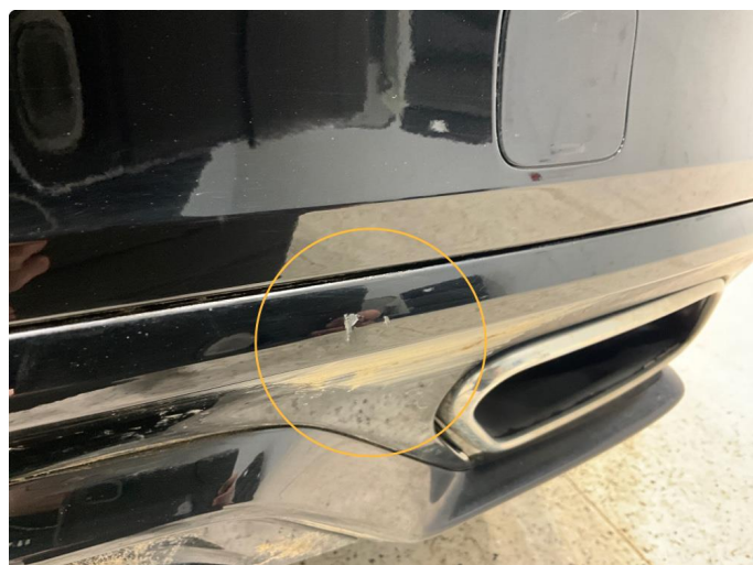
1.2 Noen små skrubbskader på støtfanger bak.