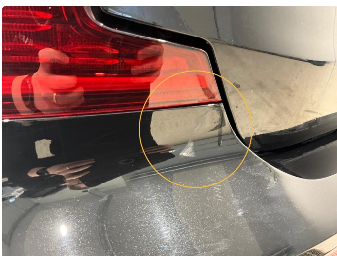
1.2 Noen små skrubbskader på støtfanger bak.