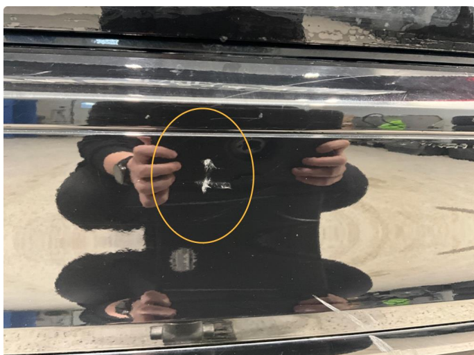
1.2 Noen små skrubbskader på støtfanger bak.