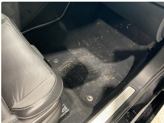
3.2 Mangler matter