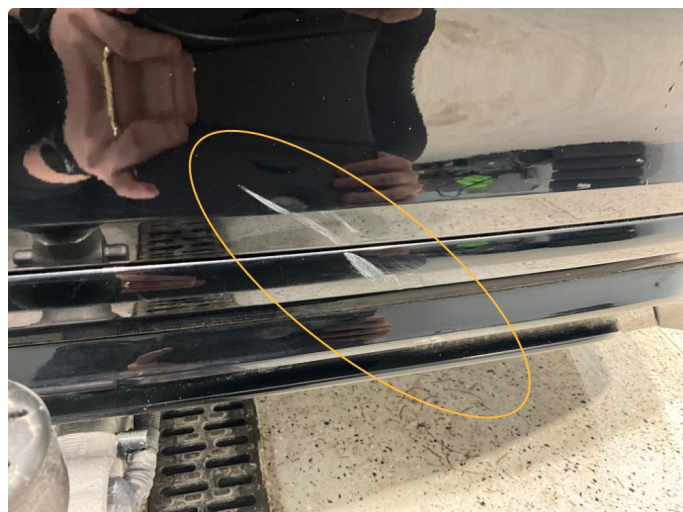
1.2 Noen små skrubbskader på støtfanger bak.