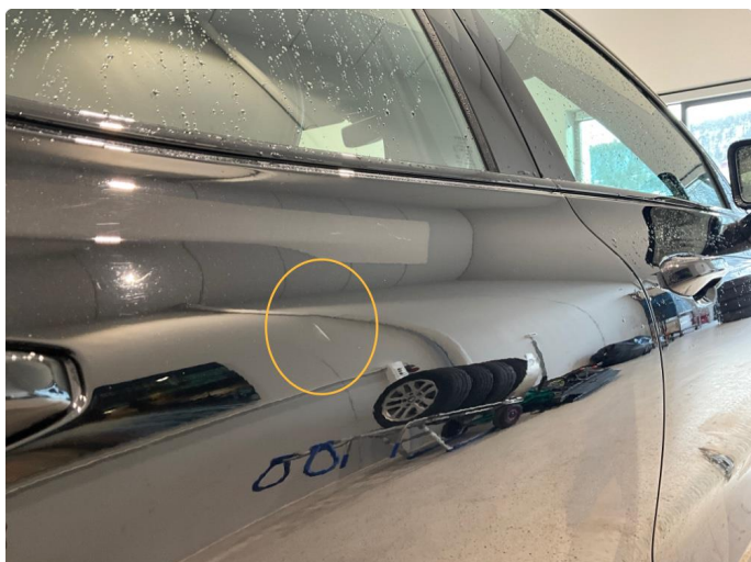
1.1 Bulk med lakkskade på dørrhøyre side bak.