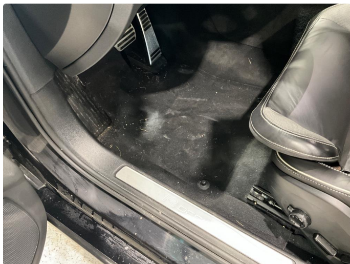
3.2 Mangler matter