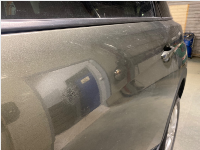
2.5 Lakkskade venstre bakdør, forsøkt rep