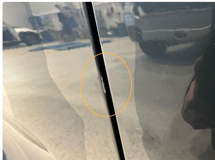
1.1 Slitasje i lakk, etter at noe inne i døråpningen har tatt tak hver gang man har åpnet døra. Høyre foran.