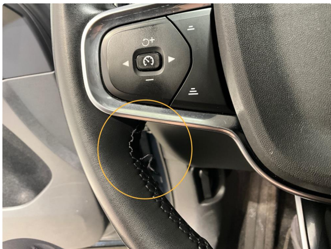
3.1 Sømmen har løsnet på venstre side av rattet.