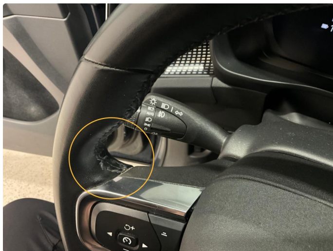
3.1 Sømmen har løsnet på venstre side av rattet.