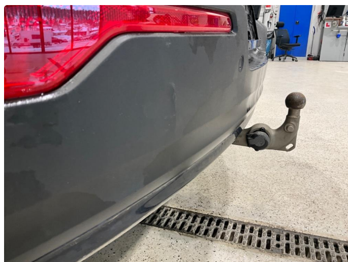
1.4 Liten bulk i støtfanger bak.