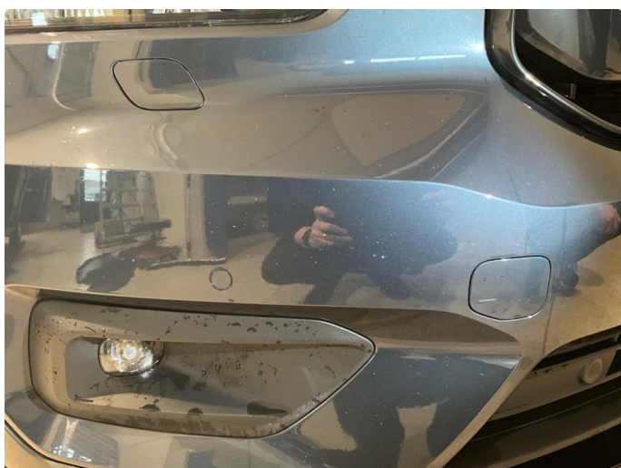
1.3 En del steinsprut på støtfanger.