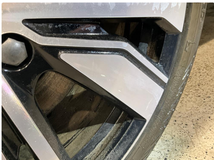
1.2 Noen småskader på felg.