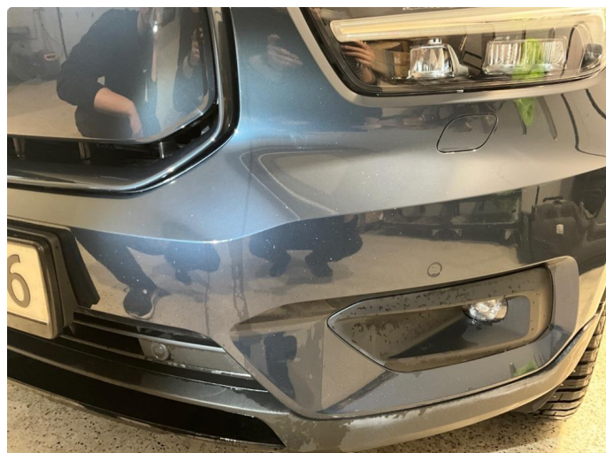
1.3 En del steinsprut på støtfanger.