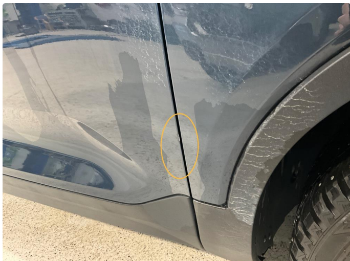
1.1 Slitasje i lakk, etter at noe inne i døråpningen har tatt tak hver gang man har åpnet døra. Høyre foran.