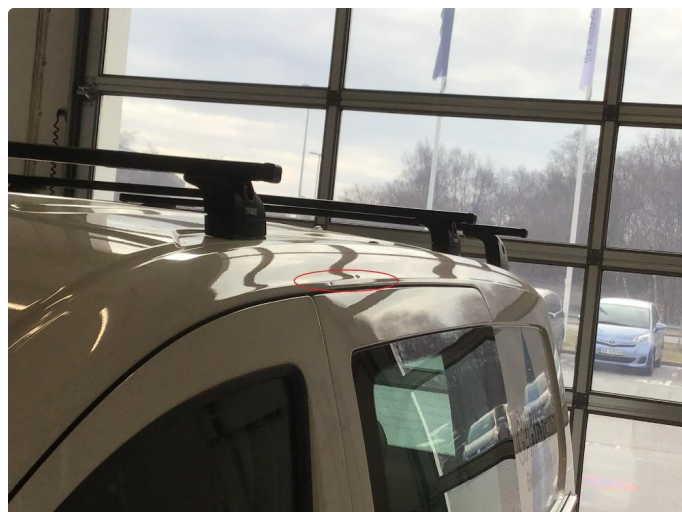
1.1 Noen Små bulker på begge sider ved reils. Ingen utbedring