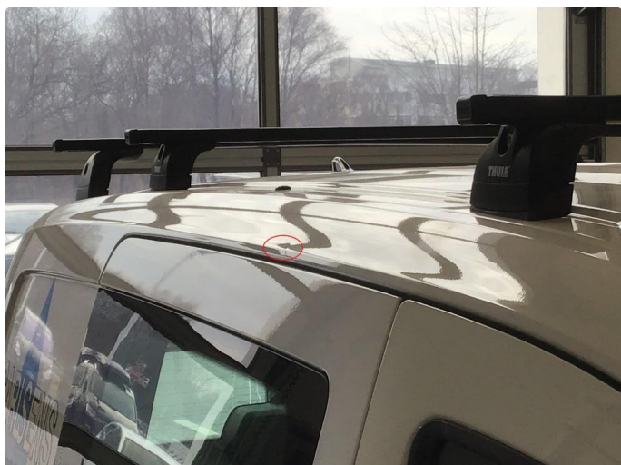
1.1 Noen Små bulker på begge sider ved reils. Ingen utbedring