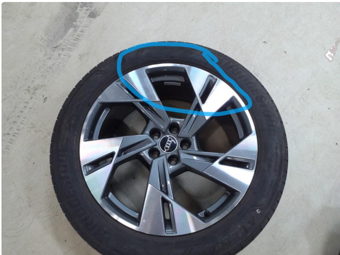
1.2 Kantkjørt felg