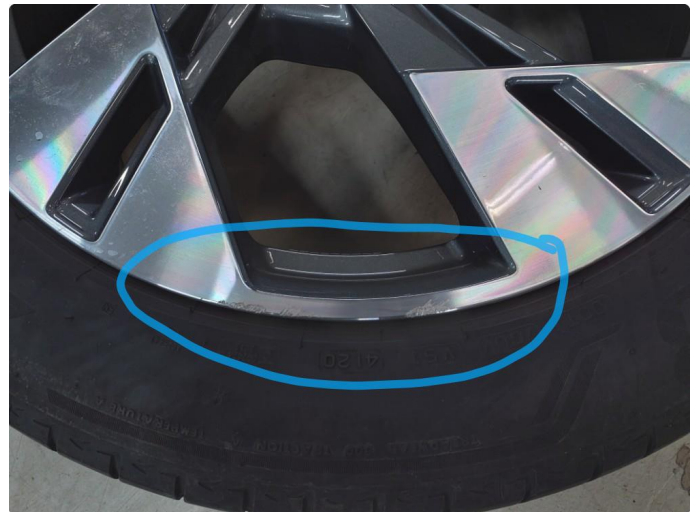
1.2 Kantkjørt felg