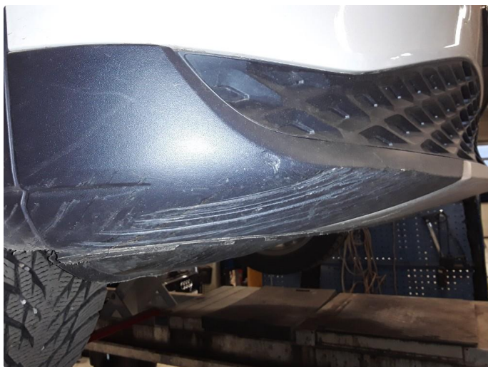
1.5 Riper i underkant plastfanger