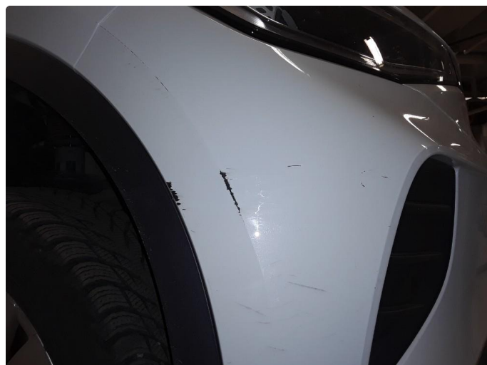
1.2 Ripe(r) ned til grunning, fleklakkert og iorden