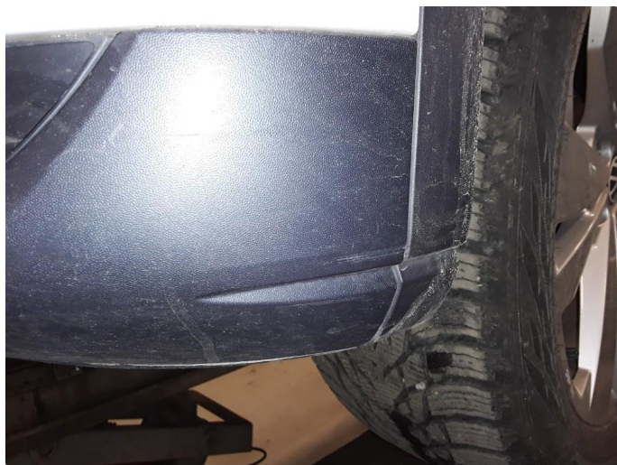
1.6 Noen riper i plastfanger underkant