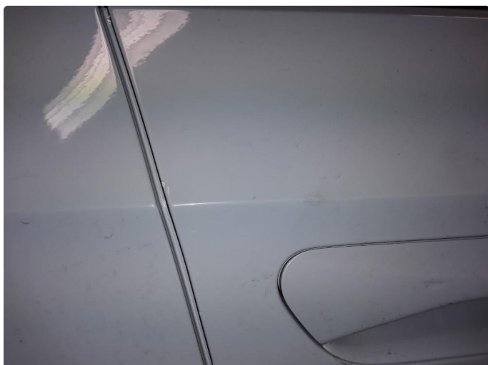
1.1 Liten bulk ved dørhåndtak