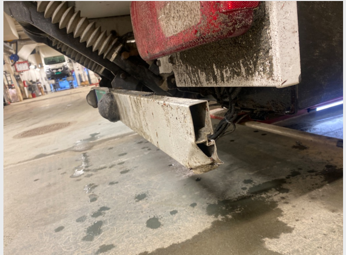
2.8 Bjelke nederst bak har noe skader på hjørner