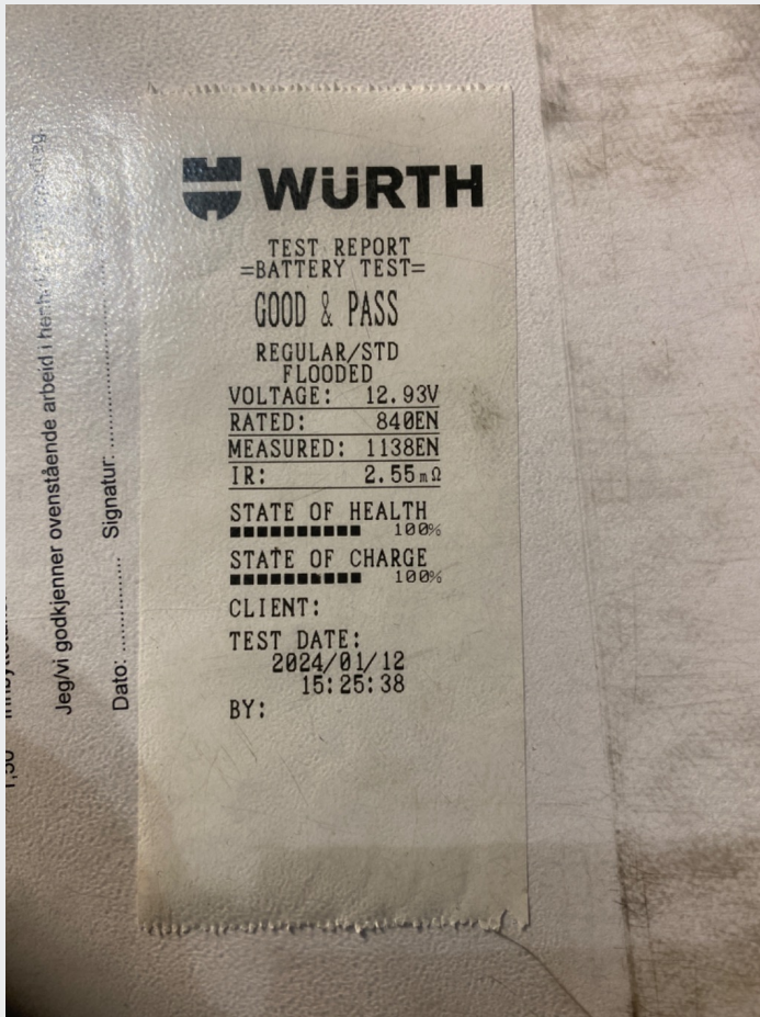
5.2 12v batteri testet ok