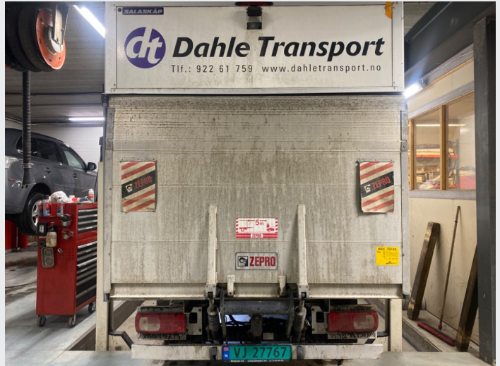
2.5 Bakluke m lift, skejv