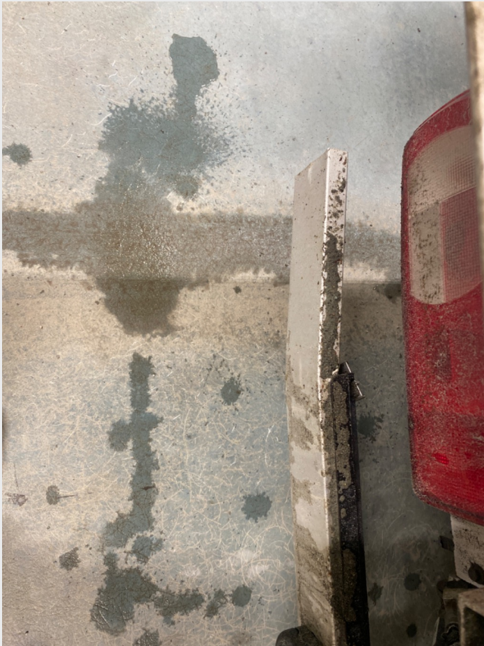
2.8 Bjelke nederst bak har noe skader på hjørner