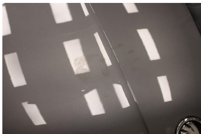
1.1 Noen mindre sår/riper rundt om på bil. Normalt for km