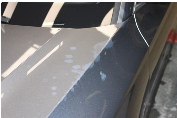
1.1 Noen mindre sår/riper rundt om på bil. Normalt for km