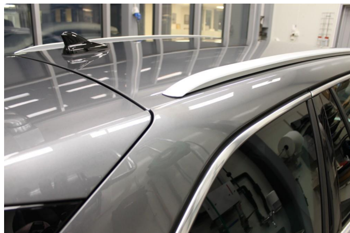
1.1 Noen mindre sår/riper rundt om på bil. Normalt for km