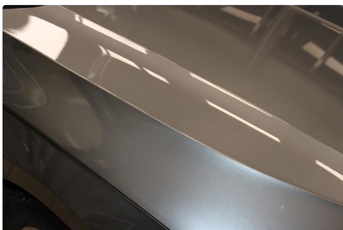
1.1 Noen mindre sår/riper rundt om på bil. Normalt for km