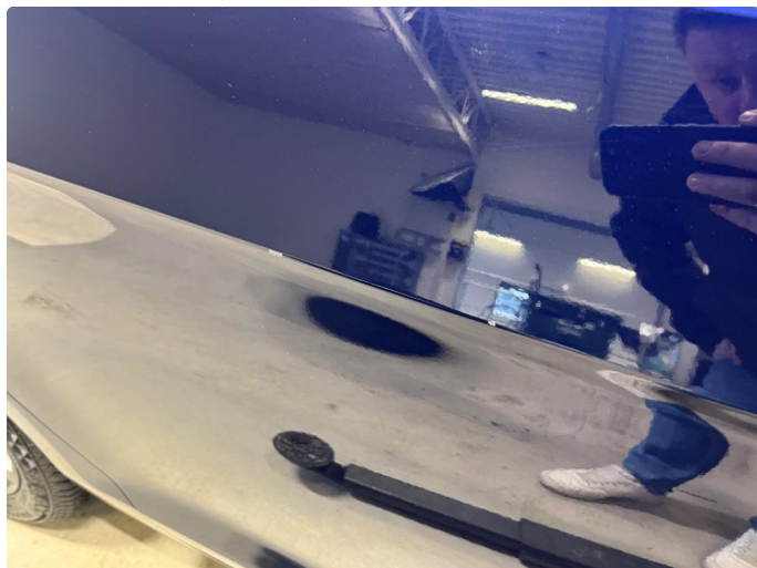
1.1 P-bulk som er flekket.