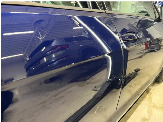
1.1 P-bulk som er flekket.