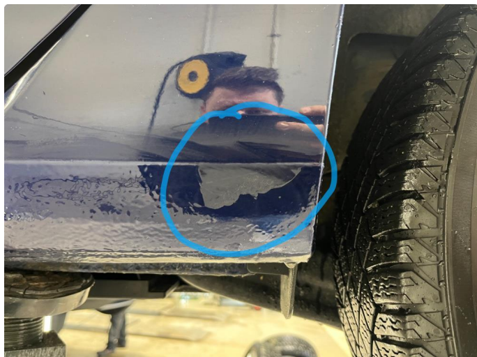
1.3 Noe lakk har flasket fra kanal høyre side bak.