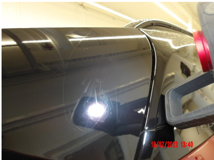
1.1 Noen riper