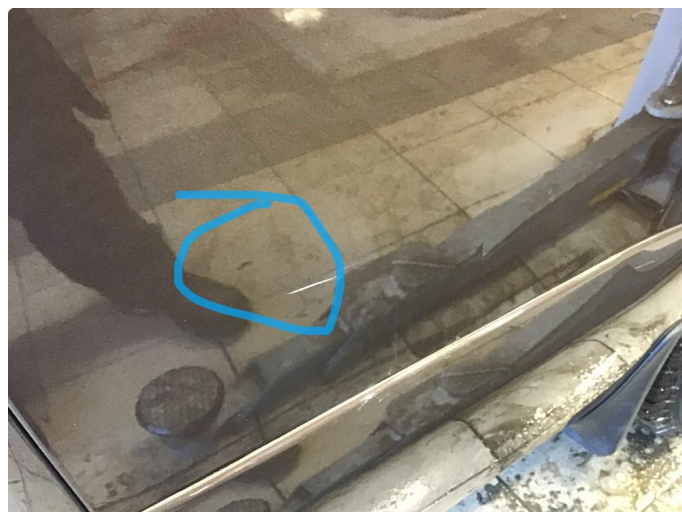
1.3 Liten p-bulk passasjerdør