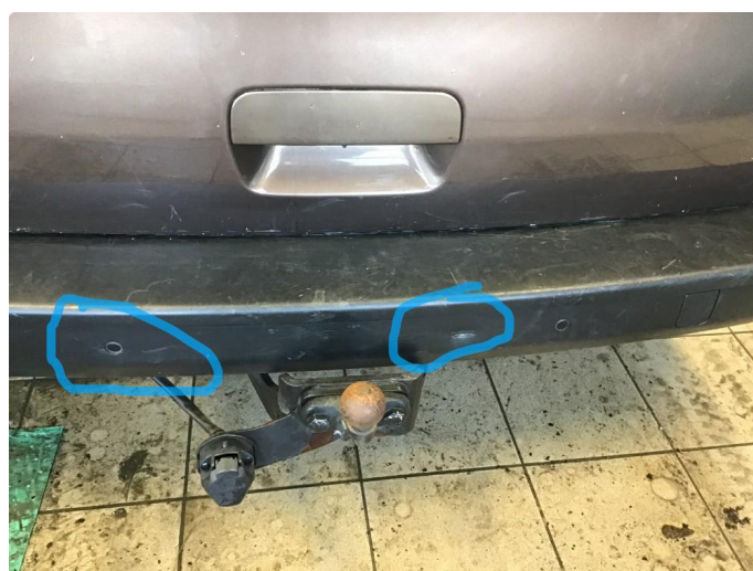
1.5 Noe slitasje på bakfanger