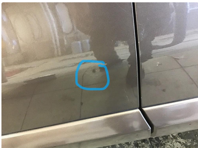
1.2 Liten p-bulk førerdør