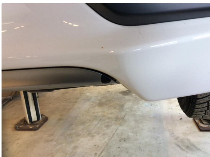
1.2 Lister skadet/mangler