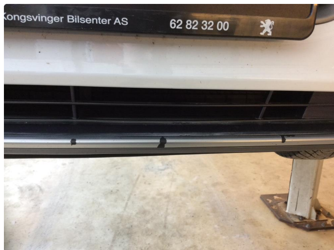
1.2 Lister skadet/mangler