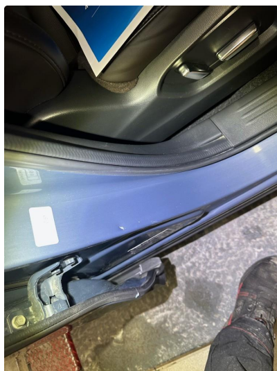
1.3 Noe små riper i innsteg