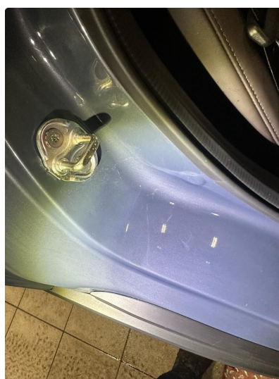
1.3 Noe små riper i innsteg