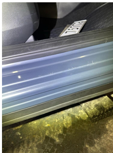
1.3 Noe små riper i innsteg