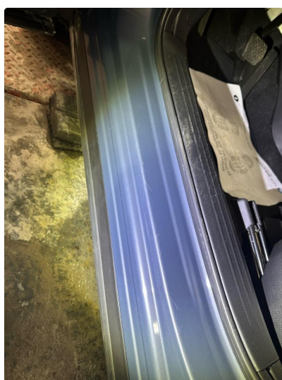
1.3 Noe små riper i innsteg