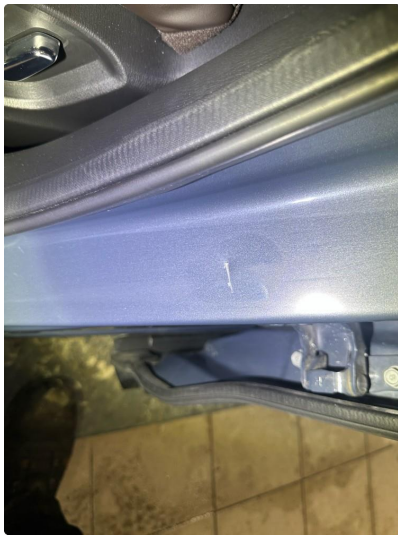
1.3 Noe små riper i innsteg