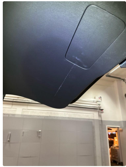
2.1 Noe bruksmerker innvendig