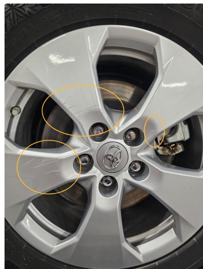
1.3 Alle vinterfelger har dype riper (skader).