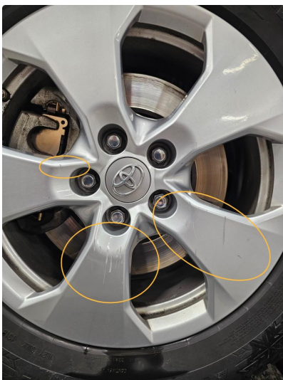
1.3 Alle vinterfelger har dype riper (skader).