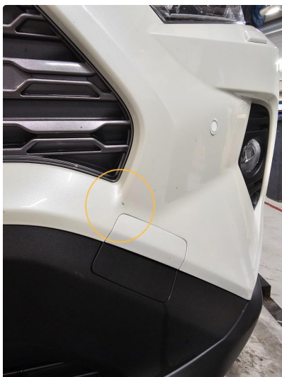
1.9 Sprekk i støtfanger. Venstre side foran.