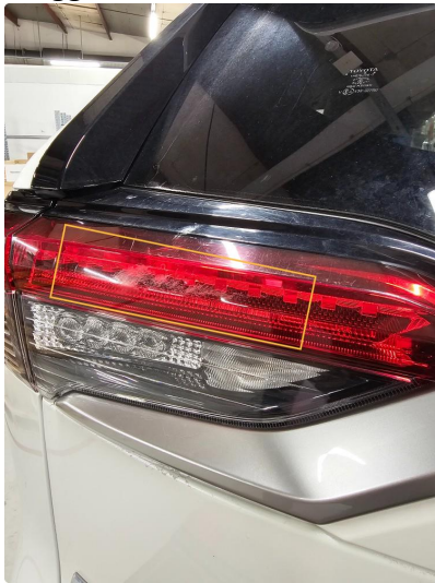
2.2 Riper på Lykt. Venstre bak.