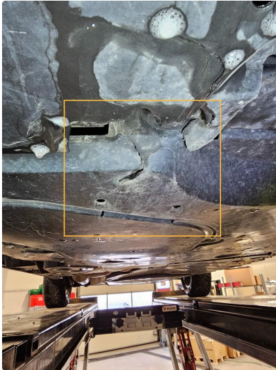
1.1 Skade på beskyttelsesplate under bil.