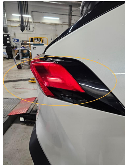
2.1 Fukt i lykt. Høyre bak.