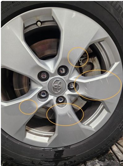
1.3 Alle vinterfelger har dype riper (skader).