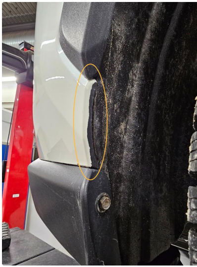
1.10 Lakkslipp på Støtfanger foran, inn mot hjulbuen. Begge sider.