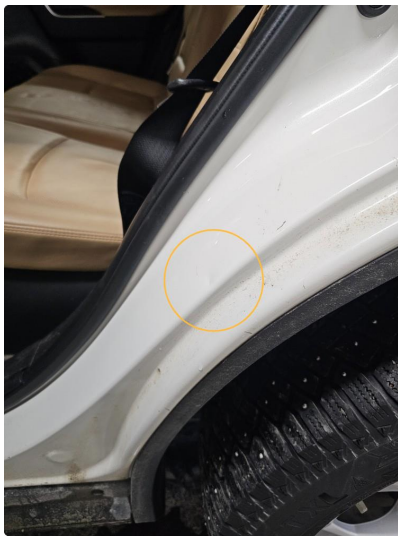
1.7 Liten bulk i døråpning. Venstre bak.