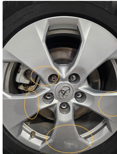
1.3 Alle vinterfelger har dype riper (skader).