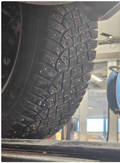
1.4 Vinterdekk begynner å bli klar for å byttes. mangler en del pigger, og resten av piggene er nedslitt.