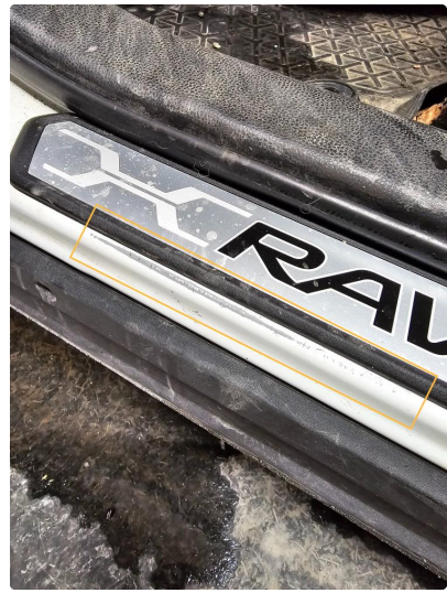
1.6 Lakk slitt på Innsteg Venstre foran.