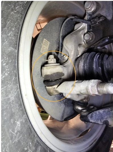
3.1 Begge ytre endeledd foran må byttes.