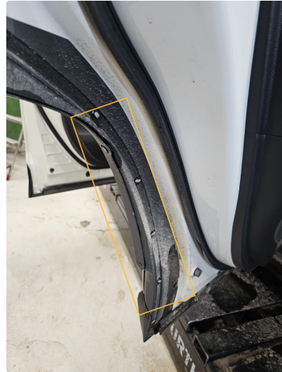
1.2 Gummipakning mangler. Venstre bak.