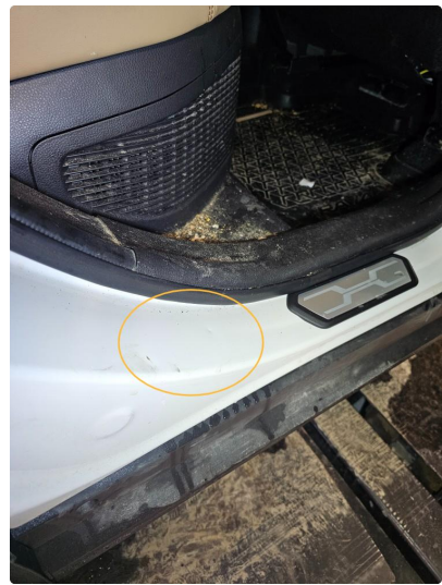
1.8 Bulker i døråpning. Høyre bak.