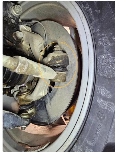
3.1 Begge ytre endeledd foran må byttes.