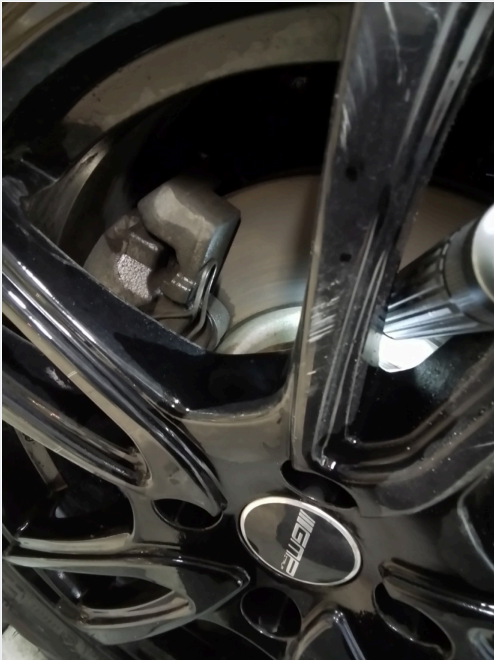
2.18 Kantkjørt vinterfelg venstre foran.