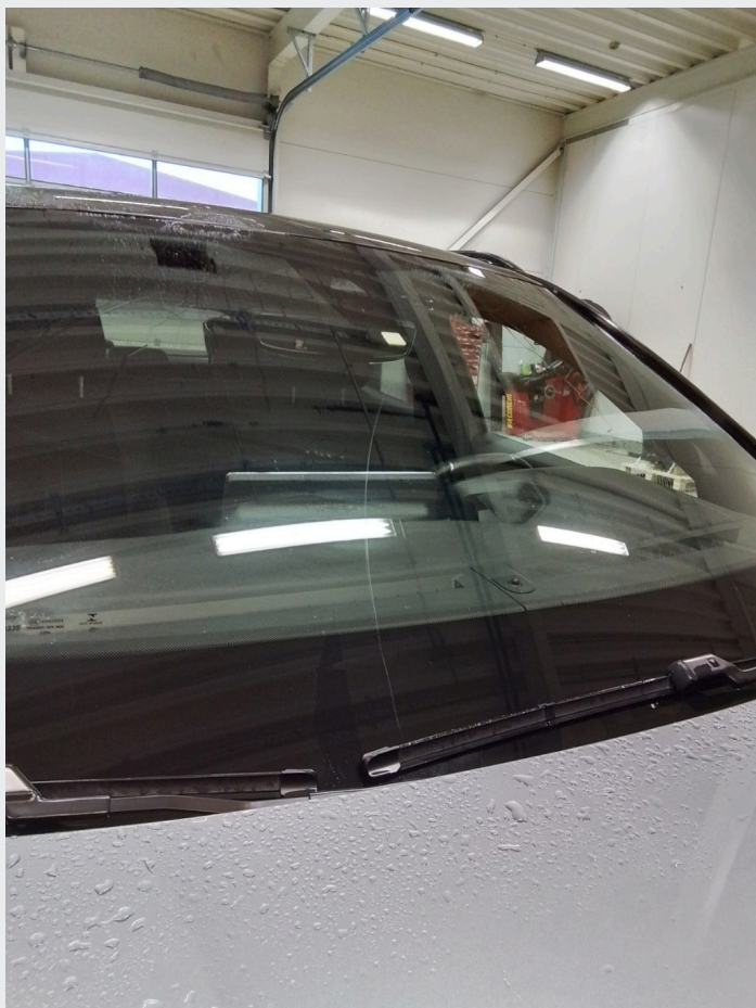
2.15 Stripe over frontvindu