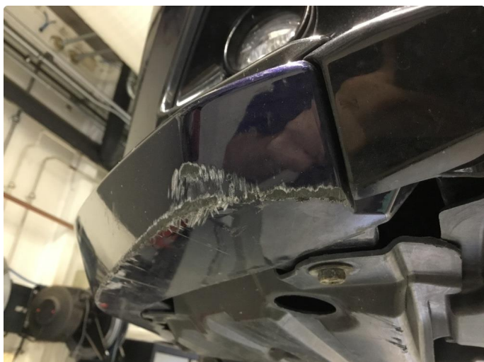
1.1 Skrubbskader underkant