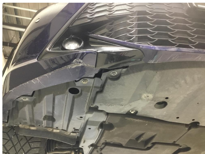
1.1 Skrubbskader underkant