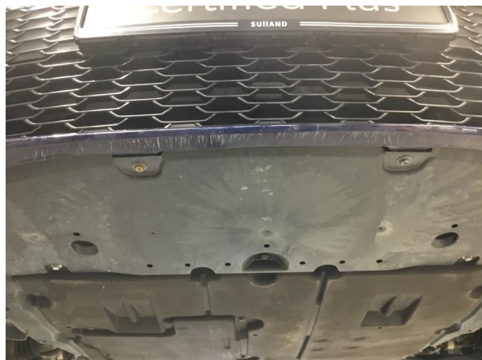
1.1 Skrubbskader underkant