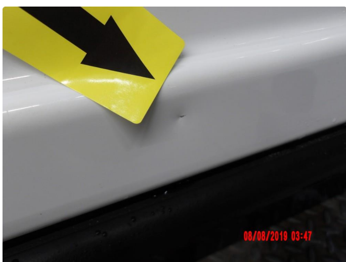
2.4 Bulk(er) med lakkskade