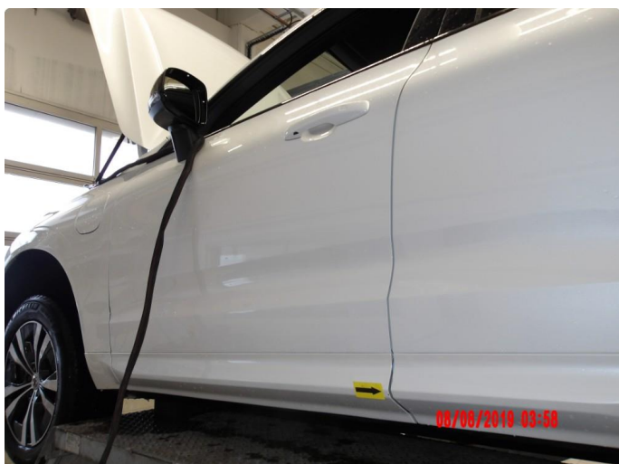
2.2 Ripe ned til grunning