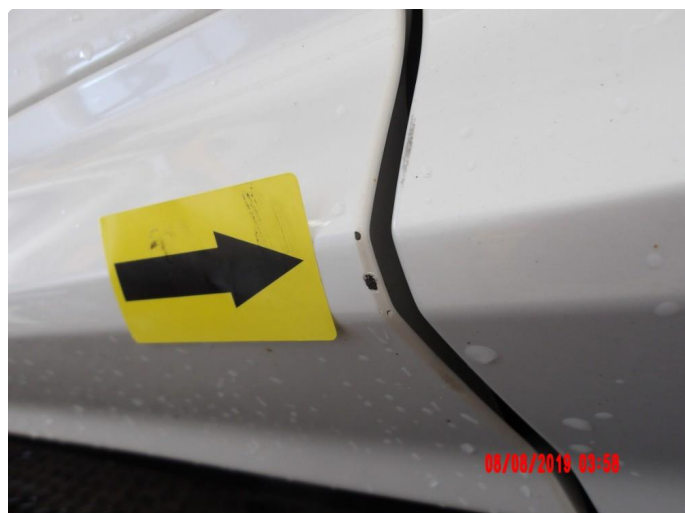
2.2 Ripe ned til grunning