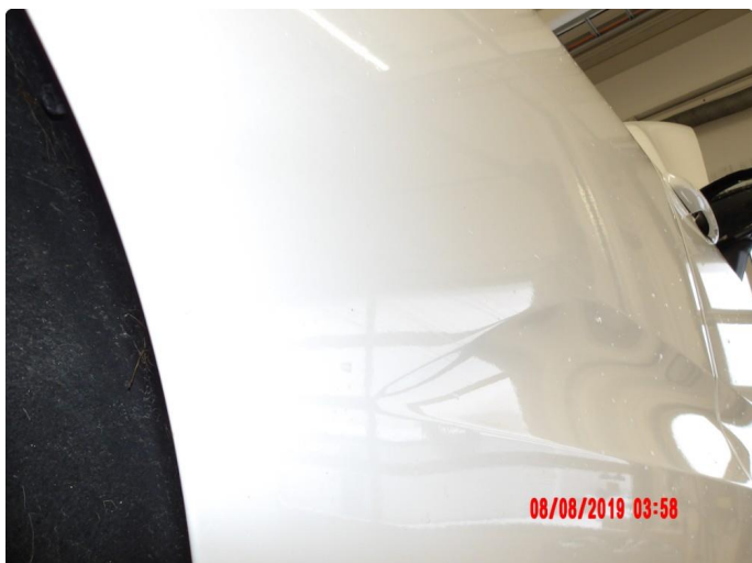
2.1 Generelt mye riper