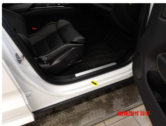
2.4 Bulk(er) med lakkskade