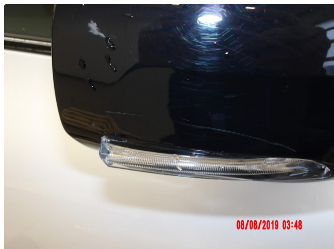
2.1 Generelt mye riper