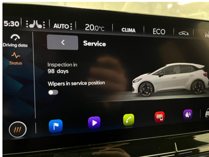
2.1 Har time for service Møller Bil Hamar 1. Mars 2024