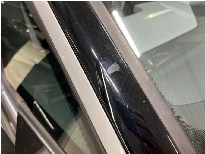
1.2 Lakk flasser