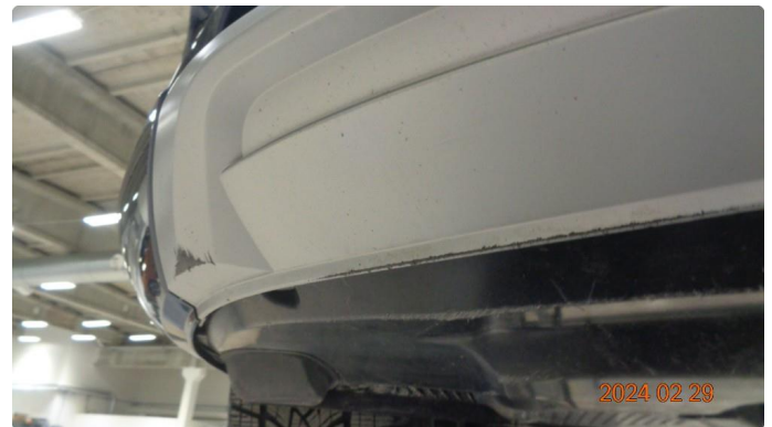
1.2 Skrubbskader underkant av støtfanger foran og noe deformert