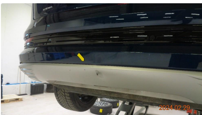
1.3 Bulk diffusor bak(er penslet) og bulk + sprekk støtfanger bak nedre del