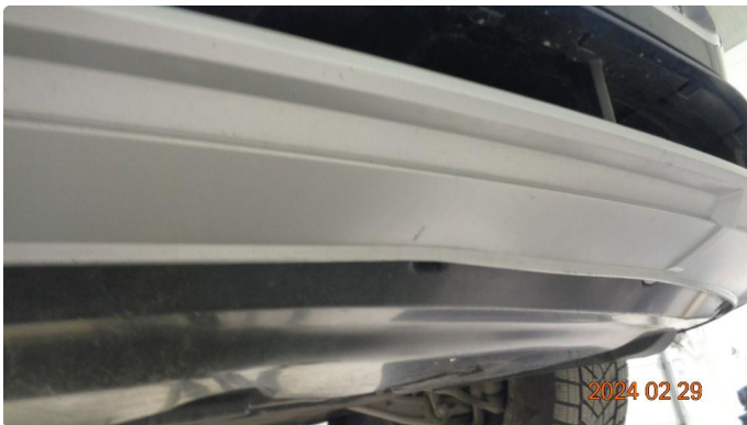
1.2 Skrubbskader underkant av støtfanger foran og noe deformert