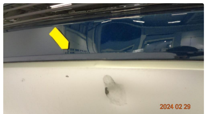
1.3 Bulk diffusor bak(er penslet) og bulk + sprekk støtfanger bak nedre del