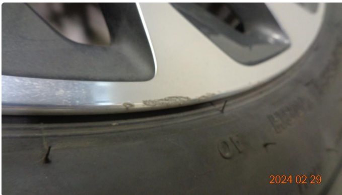
1.1 Noe kantkjørt sommerfelg