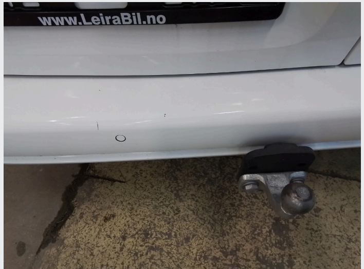
2.8 Noen småsår på bakfanger til venstre for hengerfeste