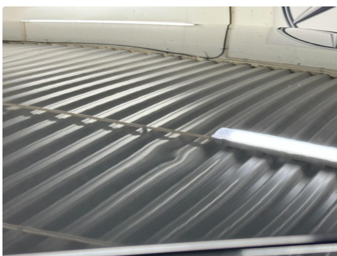
1.4 Liten bulk.