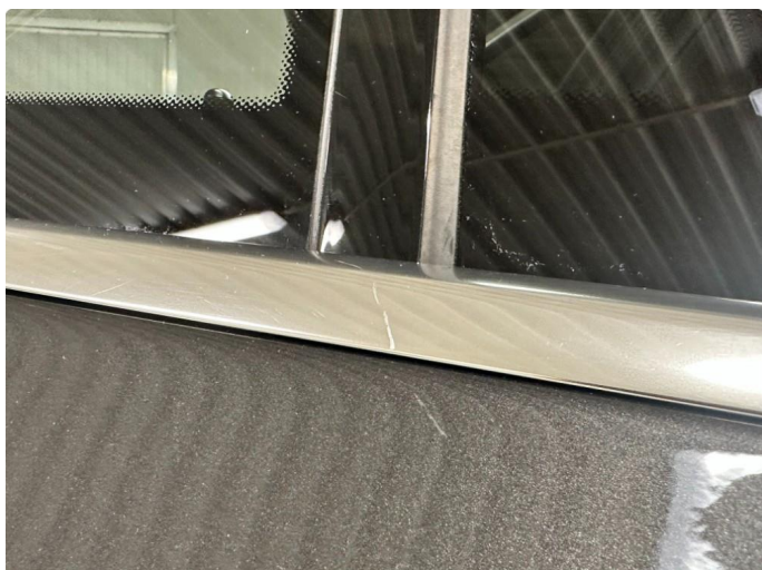
1.1 Ripe på pyntelist.