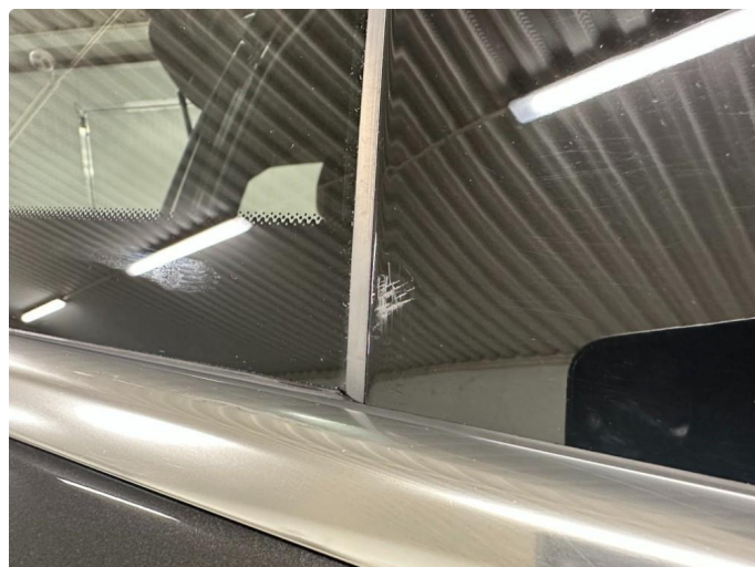
1.2 Merke på dør.