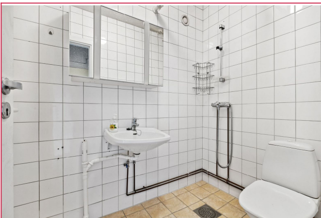
Bad med opplegg for vaskemaskin.