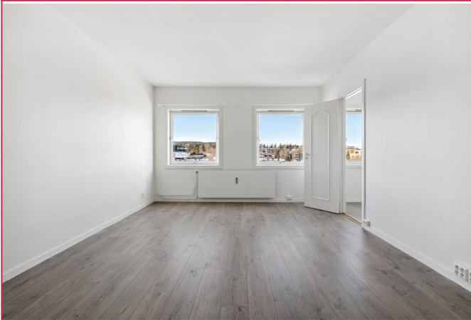
Stor og 1-roms! God plass til å møblere. Bilder er av lignende leilighet.