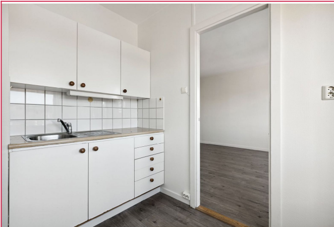
Kjøkken. Hvitvarer medfølger ikke!