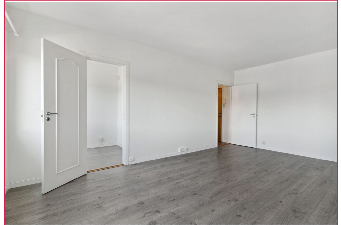
Grunnpakke Tv og internett er inkludert.