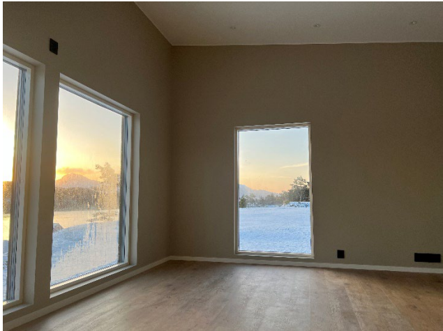
Del av stove, her kjem det peisovn i hjørnet