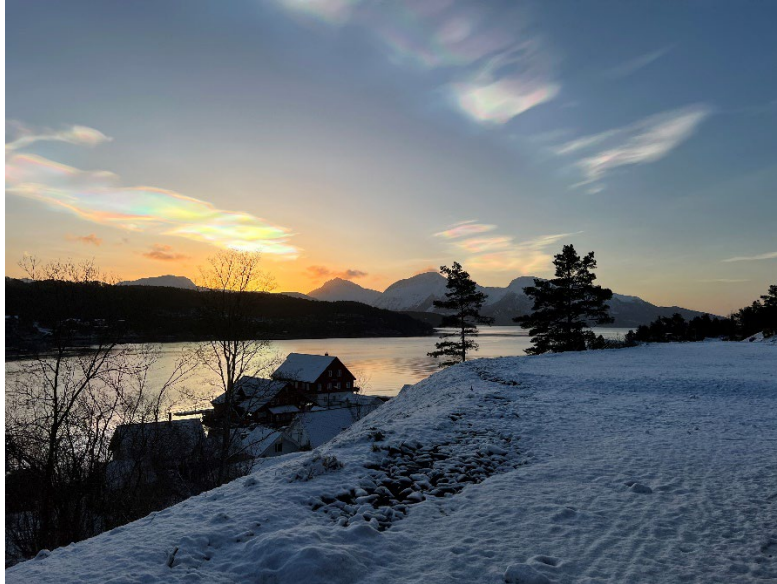
Utsikt frå framtidig terrasse