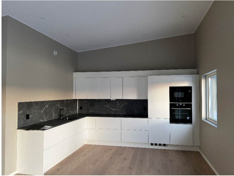
Kjøkken med kvitevarer