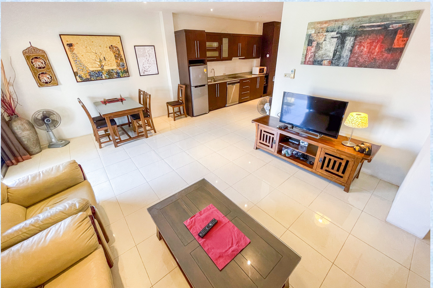
En fullt ut møblert og utrustet leilighet klar til innflytning.