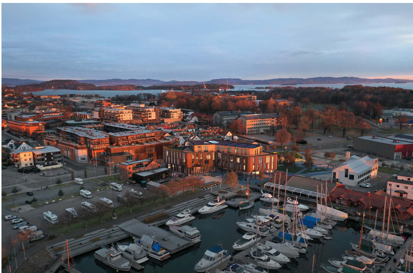
Fotomontasjer: Spir Arkitekter AS