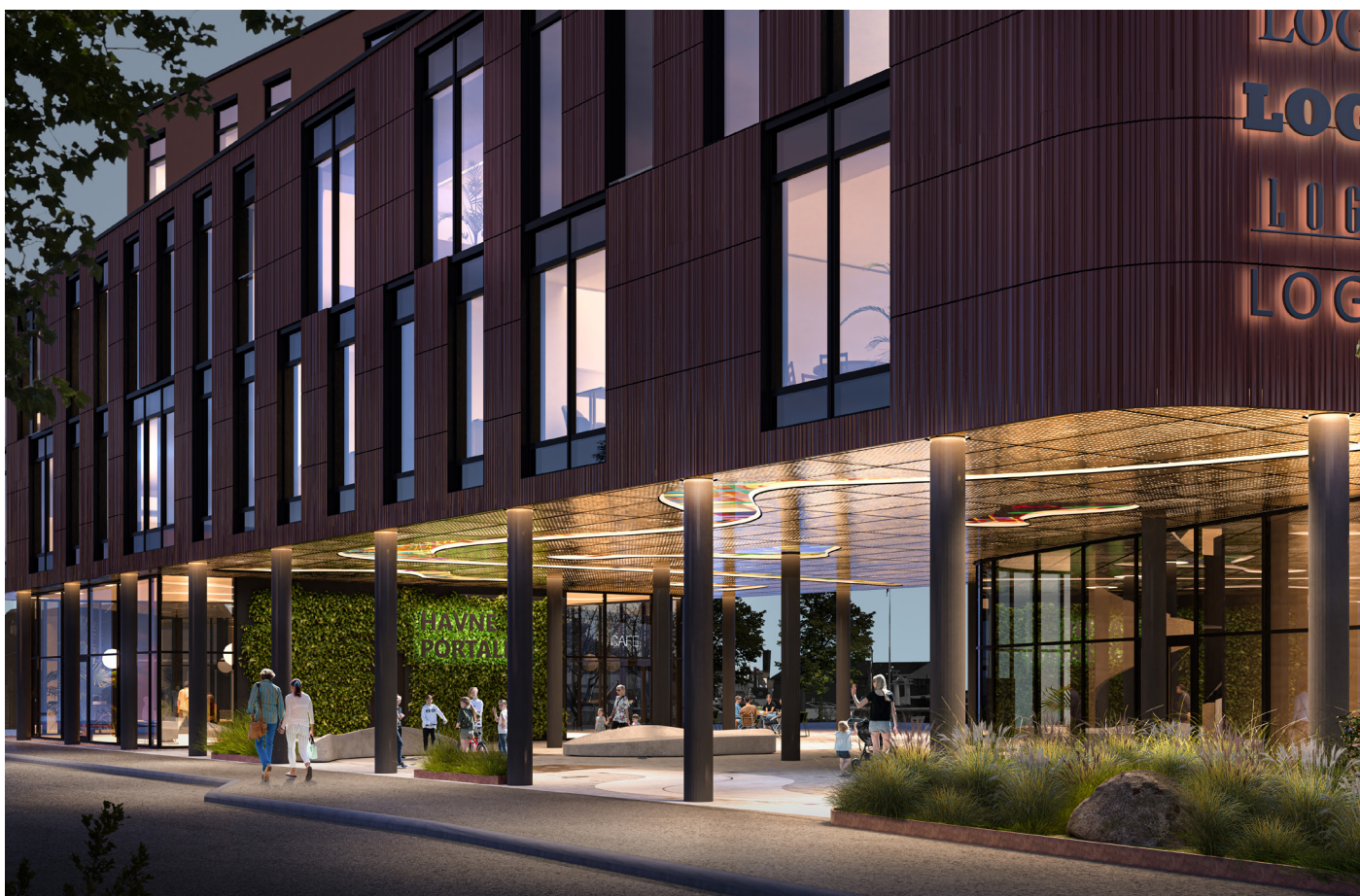
Illustrasjoner: Spir Arkitekter AS