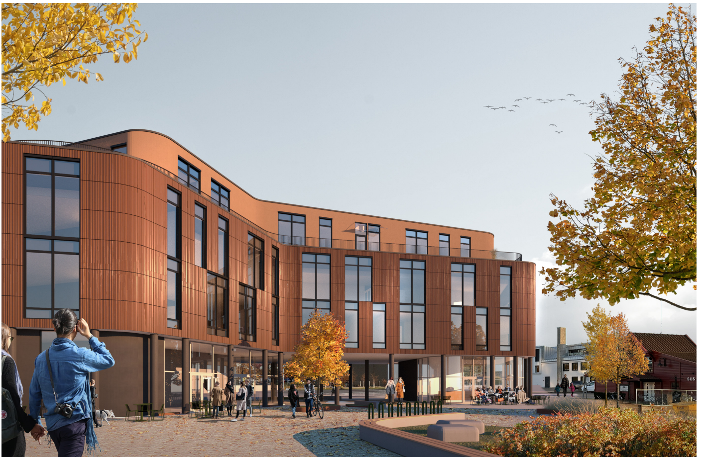
Illustrasjon: Spir Arkitekter AS