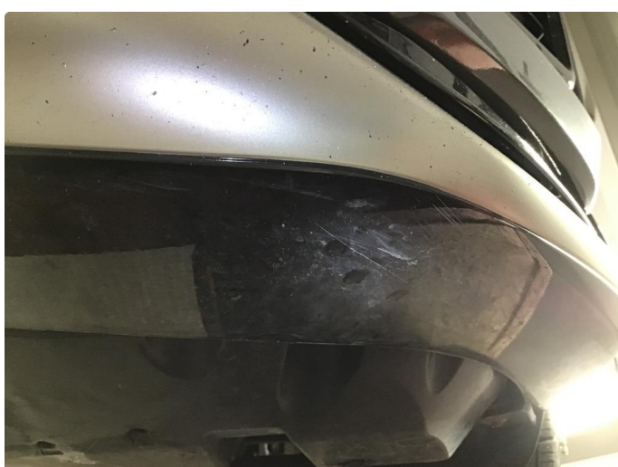
1.2 Liten skrubbskade i underkant av støtfanger foran