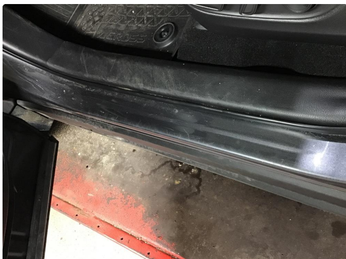
1.1 Noen riper i innsteg