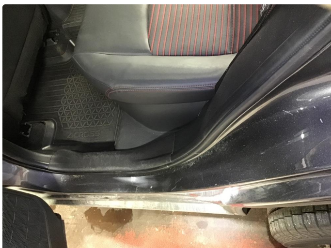
1.1 Noen riper i innsteg