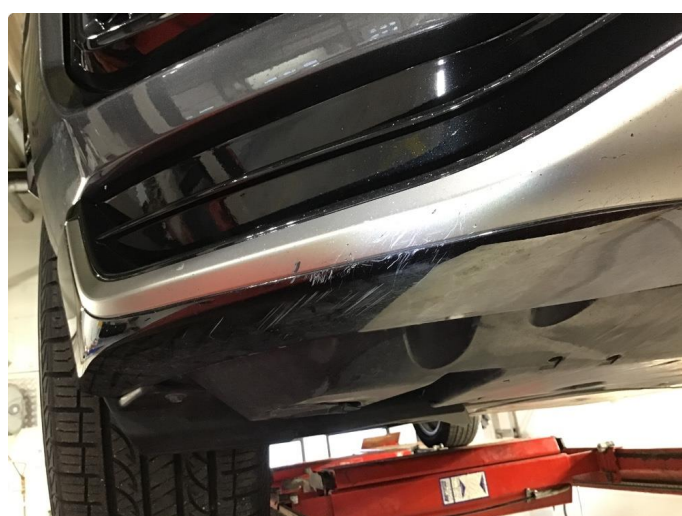
1.2 Liten skrubbskade i underkant av støtfanger foran