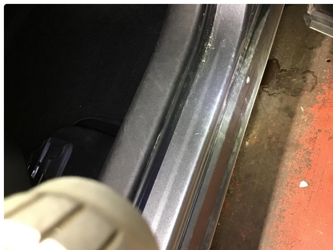
1.1 Noen riper i innsteg