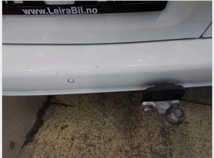
2.8 Noen småsår på bakfanger til venstre for hengerfeste