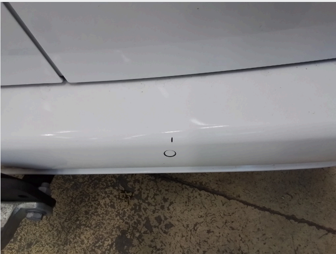
2.8 Noen småsår på bakfanger til venstre for hengerfeste