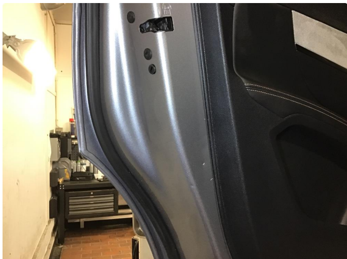
1.1 Små bulker i karm når man åpner bakdører