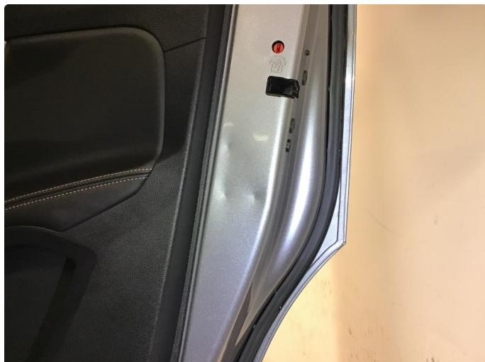
1.1 Små bulker i karm når man åpner bakdører