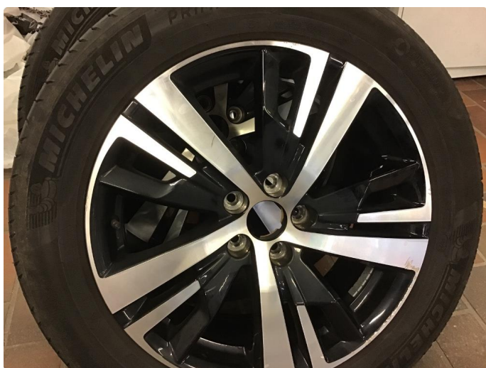
1.2 Små merker felg