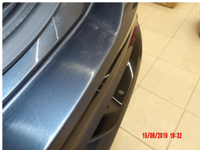
1.1 Generelt mye riper