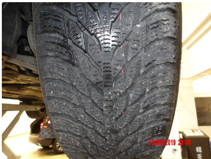
1.3 For lite mønsterdybde vinterdekk premium