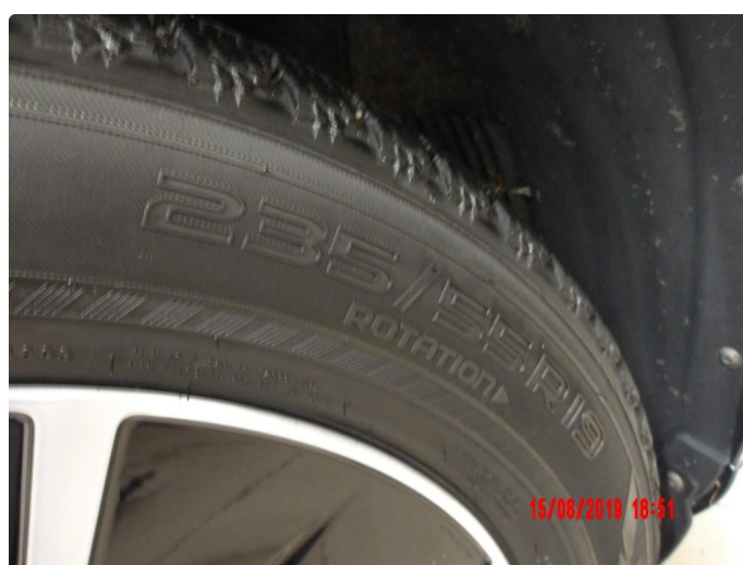
1.3 For lite mønsterdybde vinterdekk premium