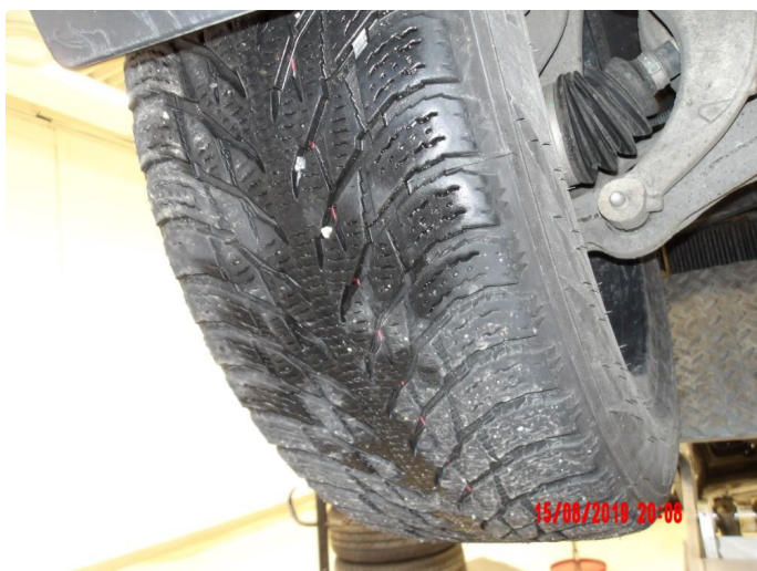
1.3 For lite mønsterdybde vinterdekk premium