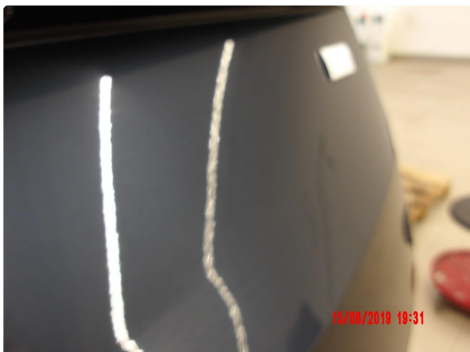
1.1 Generelt mye riper