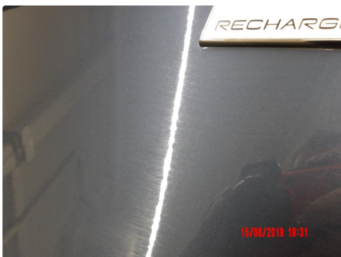
1.1 Generelt mye riper