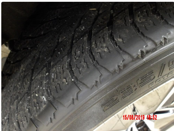
1.3 For lite mønsterdybde vinterdekk premium