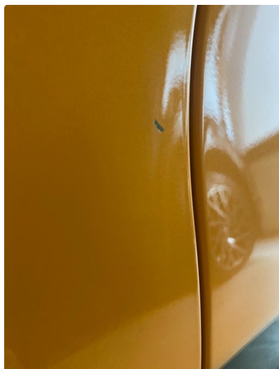
1.1 Liten steinsprut