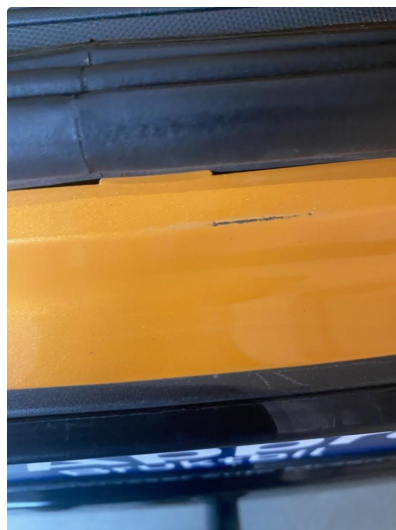
1.2 Små riper/skader i åpning bakluke.