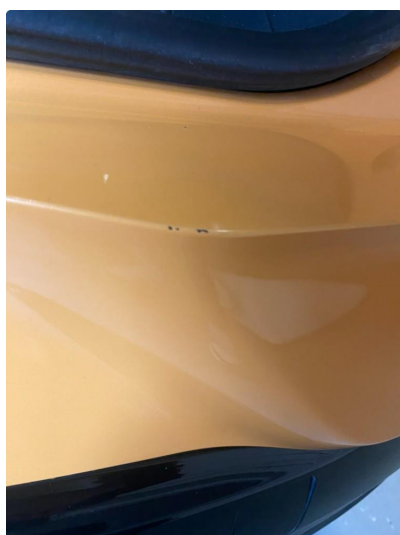
1.2 Små riper/skader i åpning bakluke.