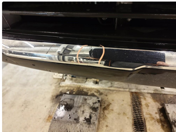
1.2 Lister skadet/mangler