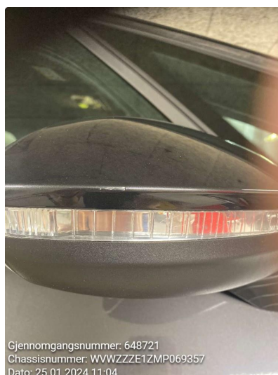
1.3 Speilhus skadet