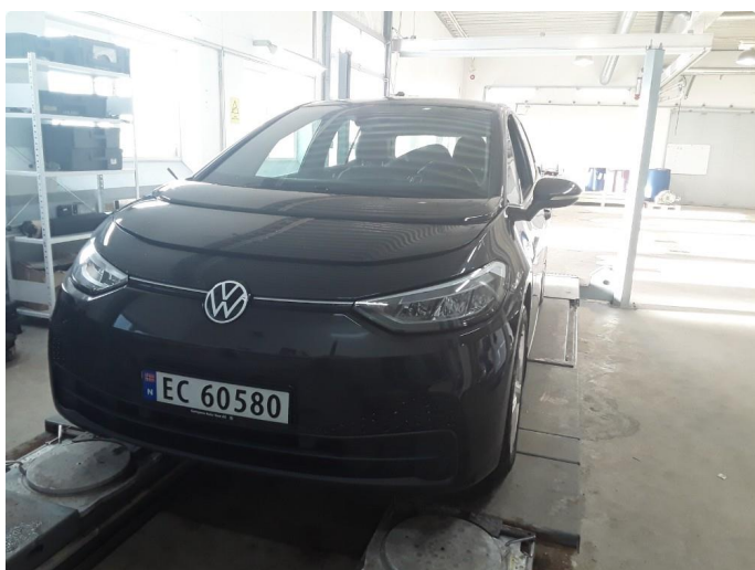
2.1 Neste service 630 dager