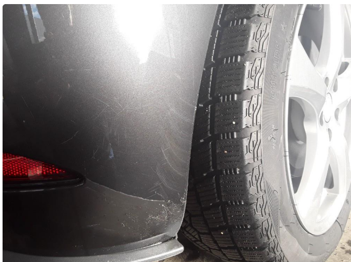
1.1 Litt smått