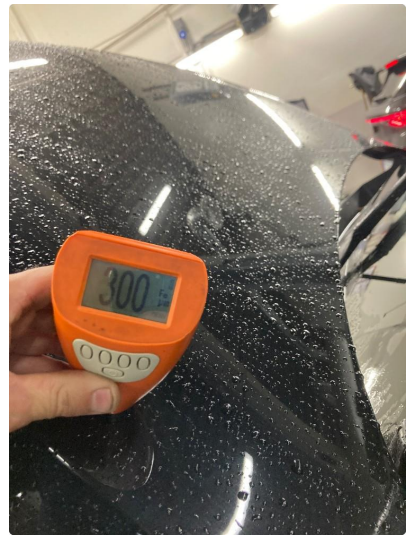
1.1 Pannser lakert og venstre baksjerm.