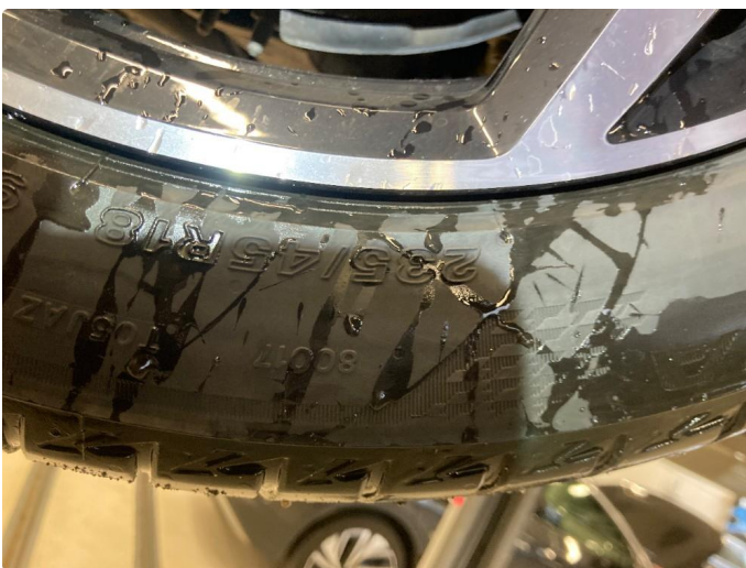
1.3 - kantkjørt felg h.s.b pris: 9040 plus mva. - 4 nye dekk 7792 plus mva. - firhjulskontroll 1592 plus mva. - kalibrering radar/kamra 2392 plus mva. totalt 20816 plus mva.