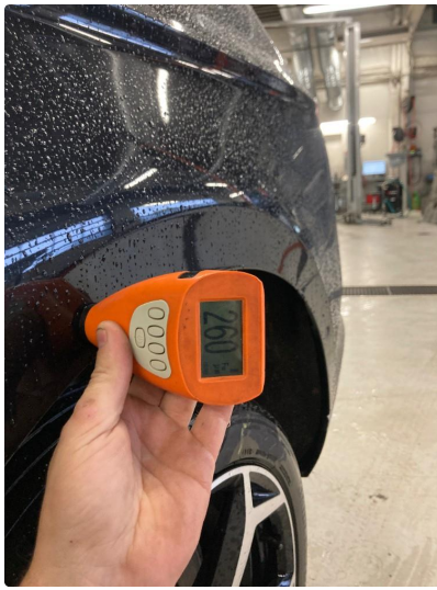
1.1 Pannser lakert og venstre baksjerm.