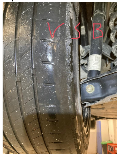
1.3 - kantkjørt felg h.s.b pris: 9040 plus mva. - 4 nye dekk 7792 plus mva. - firhjulskontroll 1592 plus mva. - kalibrering radar/kamra 2392 plus mva. totalt 20816 plus mva.