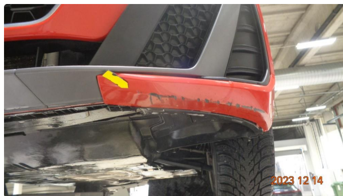
1.2 Skrubbskader underkant støtfanger foran