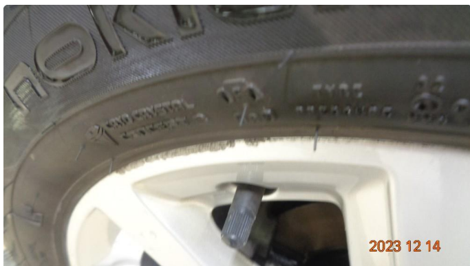
1.1 Kosmetisk skade på vinterfelg