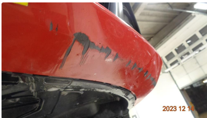
1.2 Skrubbskader underkant støtfanger foran