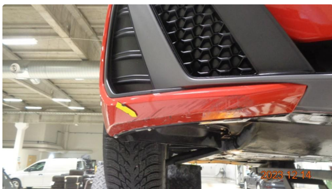
1.2 Skrubbskader underkant støtfanger foran