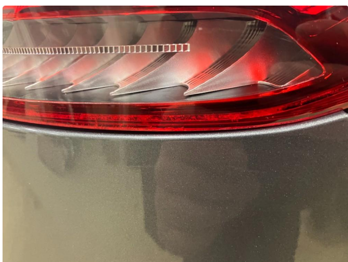
2.1 Krakelering i plast Kommentar: Blir utbedret på garanti