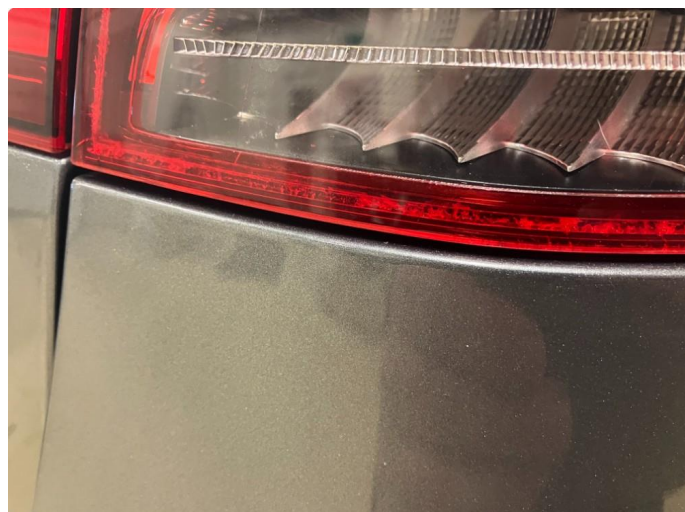
2.1 Krakelering i plast Kommentar: Blir utbedret på garanti