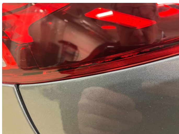
2.1 Krakelering i plast Kommentar: Blir utbedret på garanti