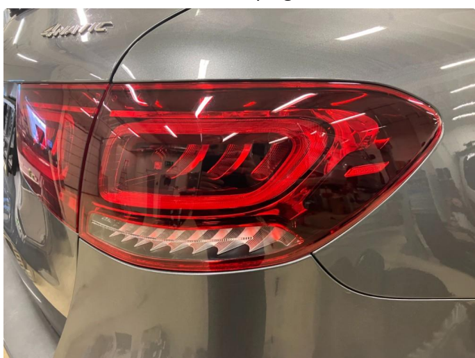
2.1 Krakelering i plast Kommentar: Blir utbedret på garanti