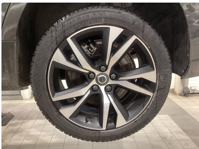
1.1 Informasjons bilder vinterhjul