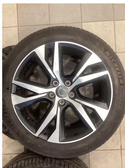
1.2 Informasjons bilder sommerhjul