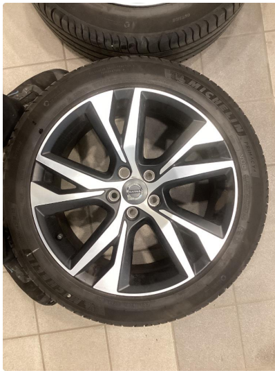
1.2 Informasjons bilder sommerhjul