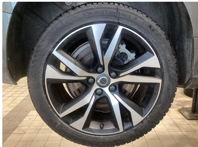
1.1 Informasjons bilder vinterhjul