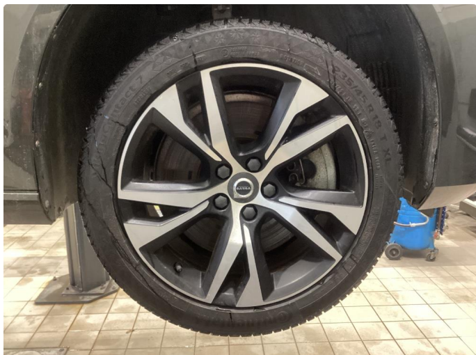
1.1 Informasjons bilder vinterhjul