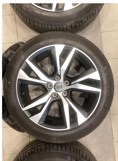
1.2 Informasjons bilder sommerhjul