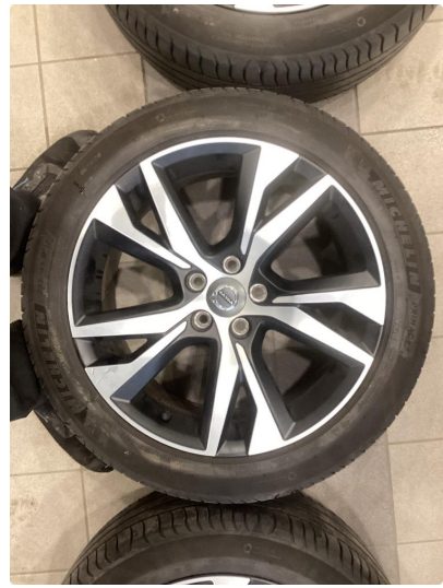
1.2 Informasjons bilder sommerhjul