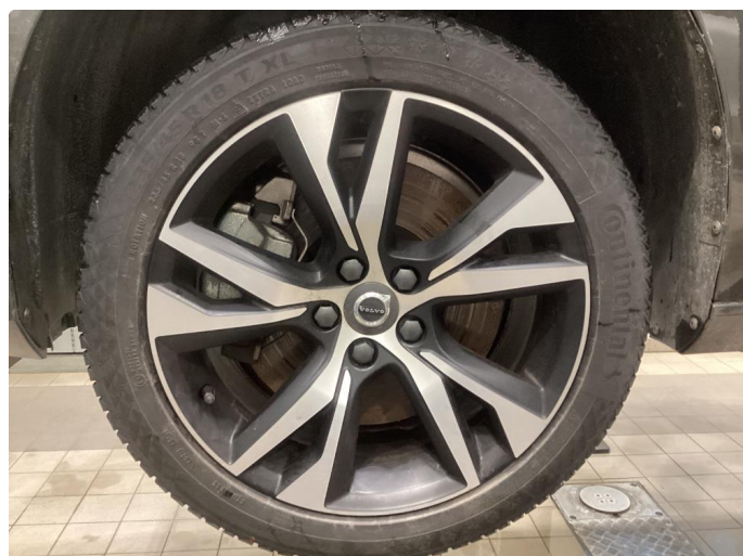
1.1 Informasjons bilder vinterhjul