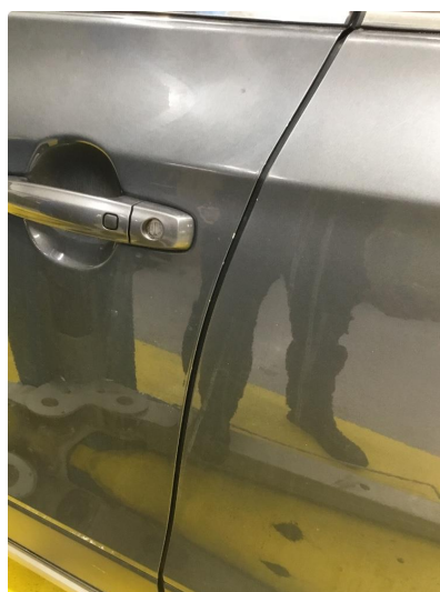
1.2 Noe steinsprut