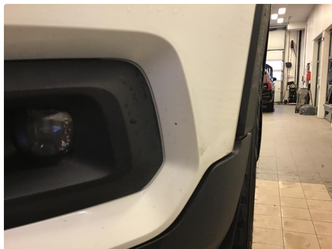
1.2 Noen små steinsprutmerker støtfanger foran.