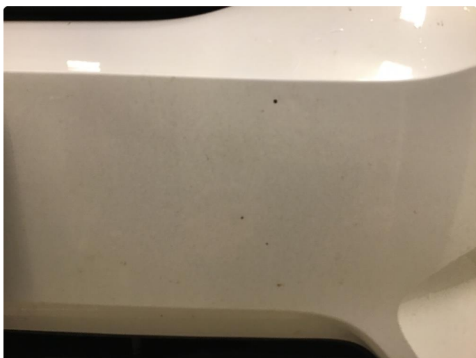
1.2 Noen små steinsprutmerker støtfanger foran.