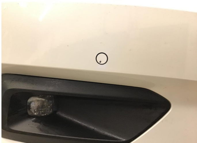
1.2 Noen små steinsprutmerker støtfanger foran.