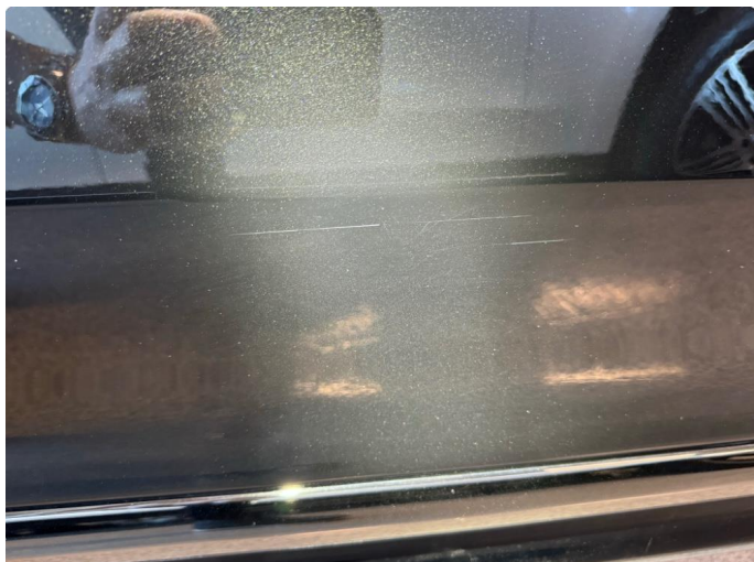
1.1 Ripe ned til grunning