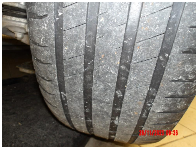
1.2 For lite mønsterdybde sommerdekk premium